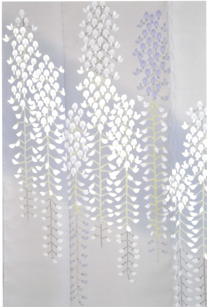
訪問着 藤花ゆるらかなり