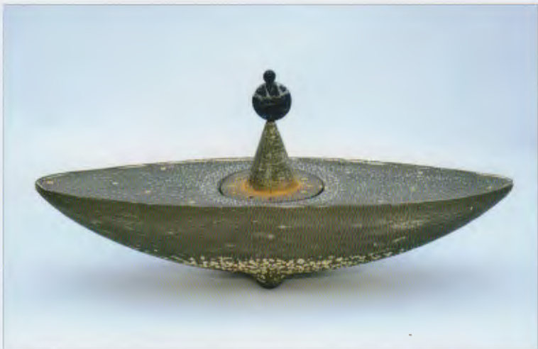
黒泥金彩香炉「あすかの宙」