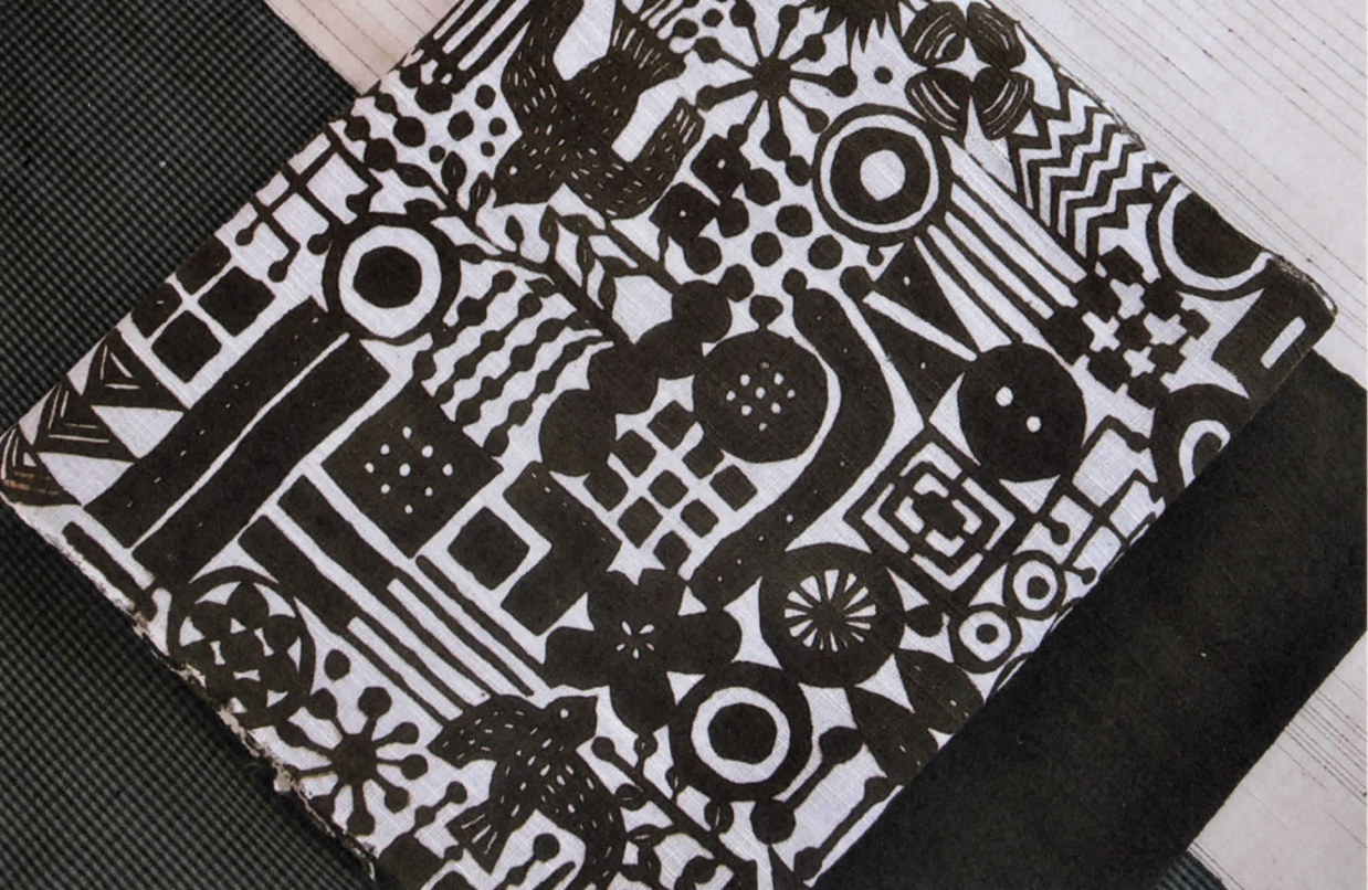
一衣會秋展・奈良五風會