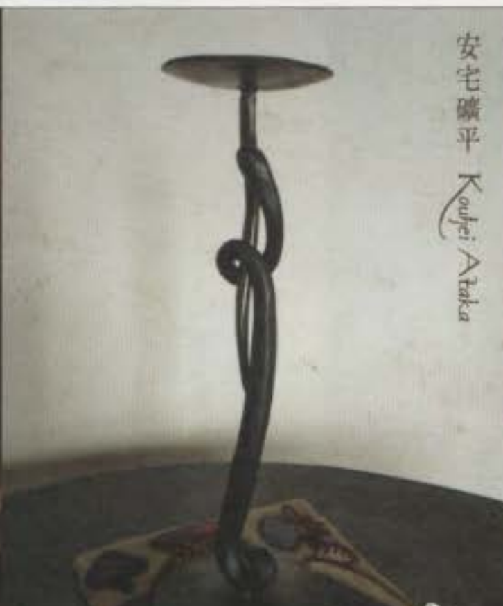
安宅磯平 Koupei Ataka