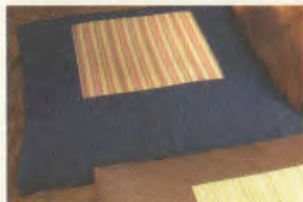
私の小座布団・唐棧綿