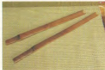
諸鼓帯/矢筈(箆通し)