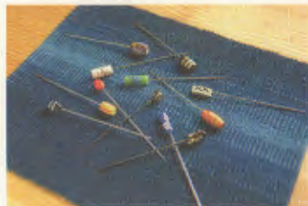
コースター/染し針