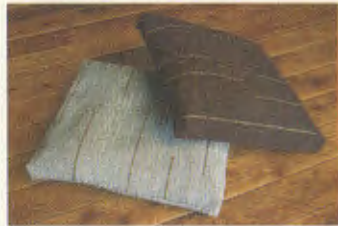
マリリンの椅子座布団・裂織り